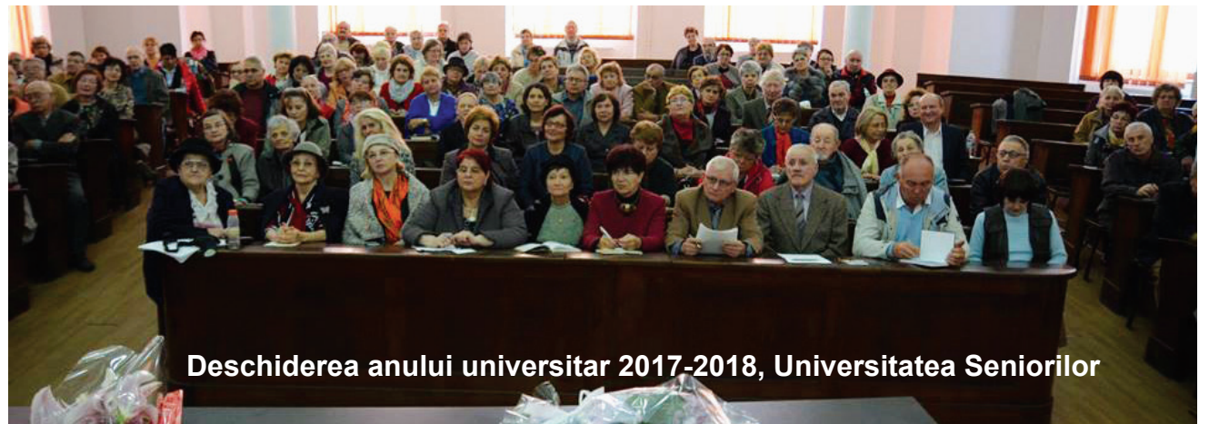
Deschiderea anului universitar 2017-2018, Universitatea Seniorilor