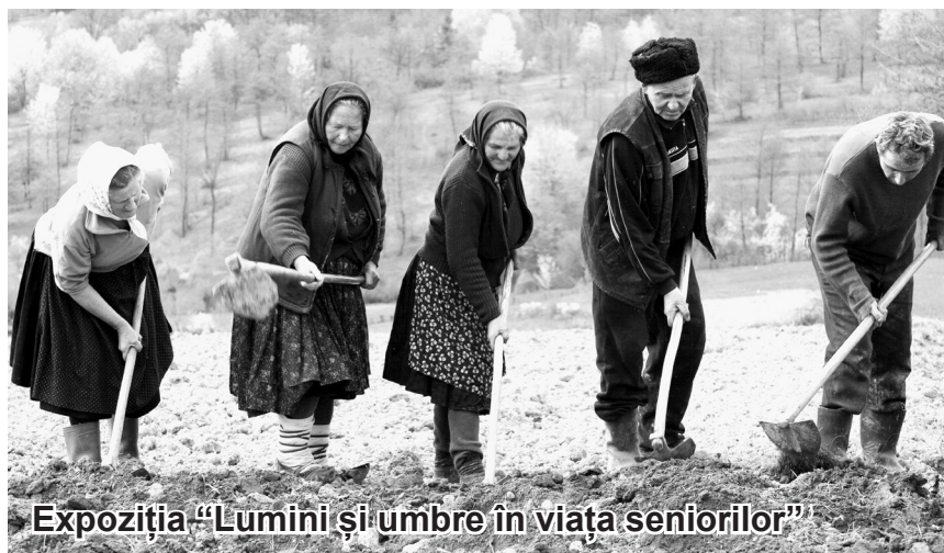
Expoziția "Lumini și umbre în viața seniorilor"

Prăbușirea sistemului comunist ne-a adus pe lângă "rația de libertate" mult visată și o porție zdravănă de capitalism. Agricultura românească este unul dintre domeniile în care, încă din zorii democrației, adică anii '90, s-a lovit din plin și din toate direcțiile. Jaful generalizat declanșat atunci, de la simplul țaran care în drum spre gospodăria proprie pleca cu o roabă cu cărămizi din fostul C.A.P./I.A.S. sau cu un cap de țevă de la sistemul de irigații și până la marea privatizare, reîmproprietărire, măcelărirea pădurilor, distrugerea industriei producătoare de utilaje și mașini agricole, desființarea stațiilor de cercetare, ne-a dat înapoi cu câteva decenii comparativ cu restul Europei. Și, ne-a făcut să regretăm amarnic vremurile în care depășeam cu recorduri absolute producția la hectar și realizam cincinalul în patru ani și jumătate. Pe lângă toate acestea, nici natura nu a mai ținut cu noi, iar pe lângă mână omului, modificările climati-